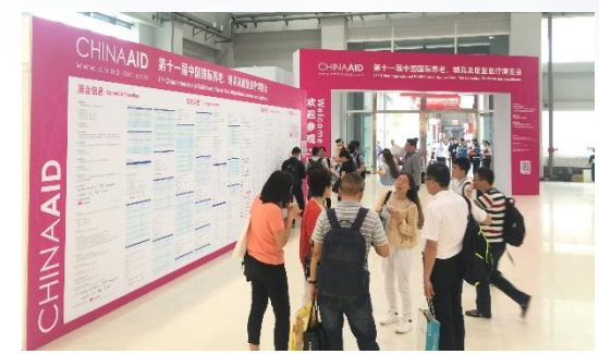
China Aid 开幕